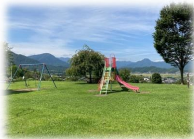
ぜひ立ち寄ってみてください

園内にある約600株の『やまつつじ』が見頃を迎えると鮮やかな朱色に染められ、まるで真っ赤に燃えているかのようです。